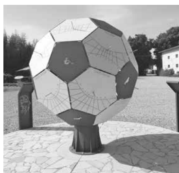
MONUMENT A ENZO BEARZOT

◆ Cumò, a Dael a son ben 123 meridianis, dutis realizadis intai ultins vincj agns. Cheste tradizion resinte e à origjin intal 1993 di une semplice vicende di vite quotidiane: un abitant dal país, Aurelio Pantanali, al à notât une asimetrie tal mûr de sô abitazion, e al à decidût di taponâle cuntune piture: par chest, al à realizade la prime meridiane.