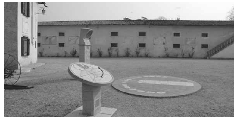
CORT DES MERIDIANIS

◆ Aes 9.00 a vierzaran chestis mostris: “Meridianis antighis e modernis dal Friûl-Vignesie Julie”