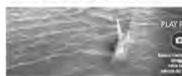
IL SCUÂL DE LAGUNE: FAKE NEWS NOSTRANE

che une fake news e pues influî su lis nestris vitis, ancje dal pont di viste economic».