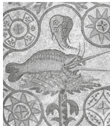
IL GJAMBAR TAI MOSAICS DI AQUILEE

◆ Sul lôr simbolisim si à cetant discutût, ma forsit i gjambers