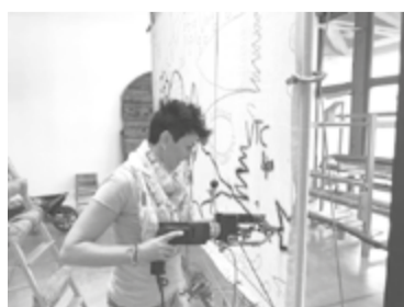
LA TECNICHE E JE CHÊ DI MESSEDÂ FILÂTS DI LANE DI OGNI COLÔR

◆ Ma cemût nassial un tapêt? "O met une tele di poliestere su chescj telârs verticâi (o 'nd ai 3 di diviersis misuris), dopo o ripuarti il dissen che mi dan o che il client al à sielzût, o pûr lu fâs jo diretremtri cuant che o lavori. Cuntun trapin (che al è tant che une machine di cusî) che al funzione a arie compresse, o scomenci a dâi vite al tapêt doprant i filâts di lane di ogni colôr (la tecniche si clame Hand Tufting ). I tapêts a vegnin