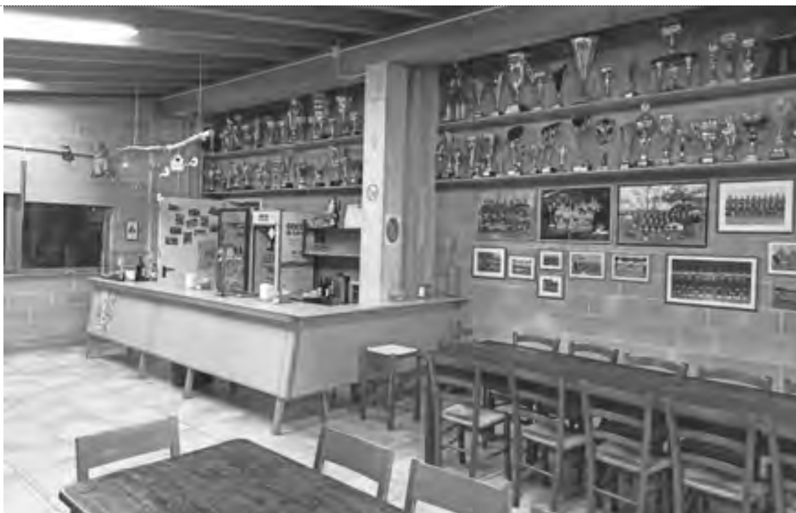
IL CHIOSC DI GIORGIUTTI

Un spirt tant che chel in Friûl lu ai cjatât ator di râr, se no che adiriture nol esist. O soi lât par un grant torneu des filiâls di une bancje in