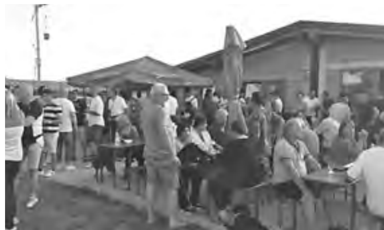
LA INT ATOR DAL CHIOSC DOPO LA PARTIDE

A nd è tancj che a son impuartants, no volarès fâ tuart a di nissun, e a son tancj che no cognòs ancjemò. Chei che a son tal gno cûr a son chel di Premariâs, li che al è simpri biel lâ a zuiâ cuintri de Azzurra, chel de Juventus Gorizia, e il gno ricuart plui biel al è di chel di Maran. O sin lâts là pe dispate par passâ in prime categorie : lôr a pensavin di vinci e duncje a vevin preparât 50 chilos di pes. Ae fin o vin vinçût nô e ancje gjoldût di chel ben di Diu: al è râr che si fasi il pes tai chioscs. E ae fin, ancje se chei di Maran a vevin pierdût, si à fate fieste ducj insiem, tal spirt dal chiosc! ■