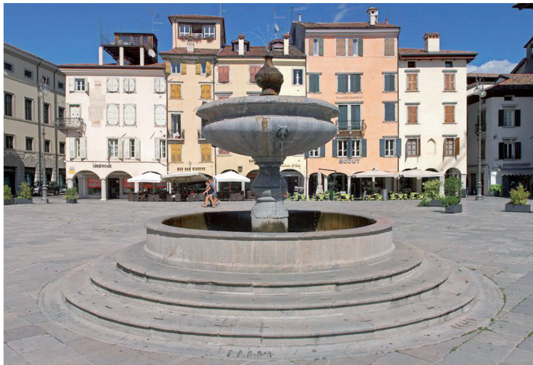
Te foto: la fontane di Zuan di Udin te place Sant Jacum.

A ZUAN DI UDIN I PROJETS che i àn dât sodisfazion a son i lavôrs fats a Udin, come la fontane di place Marçjât Gnûf, dopo Sant Jacum, vuê place Matteotti. La fontane, prime, e jere logade tal cjanton viers vie Canciani; il stîl al è sul classic antic che al conferme la classicitât dal artist. La scjalnade su la façade de tramontane dal cjistiel di Udin i à dât la inonime di «proto», ven a stâi a cjâf des mastrancis e architets public.