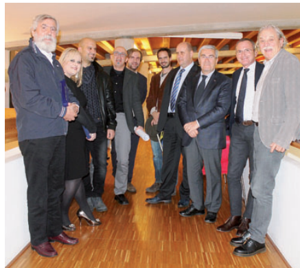
Vincidôrs, jurie e autoritâts ae ceremonie di premiazion dal San Simon.