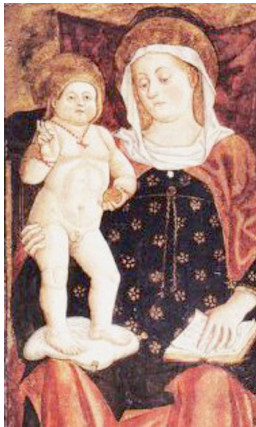
Te foto: Madone cul frut di Dree Bellunello, particulâr de pale dal domo di Sant Vît, 1488.

Dree Bellunello si firmave come Bellunotto par vie de localitât di divignince: al jere nascût intor al 1430 a Campitello sore Belum. Tal 1455 si trasferi a Sant Vît dal Tiliment, dulà che al restâ fin ae muart tal 1494. E di li al començâ a firmâ lis sôs oparis «Sanvitesse». Esaltât de int dal so