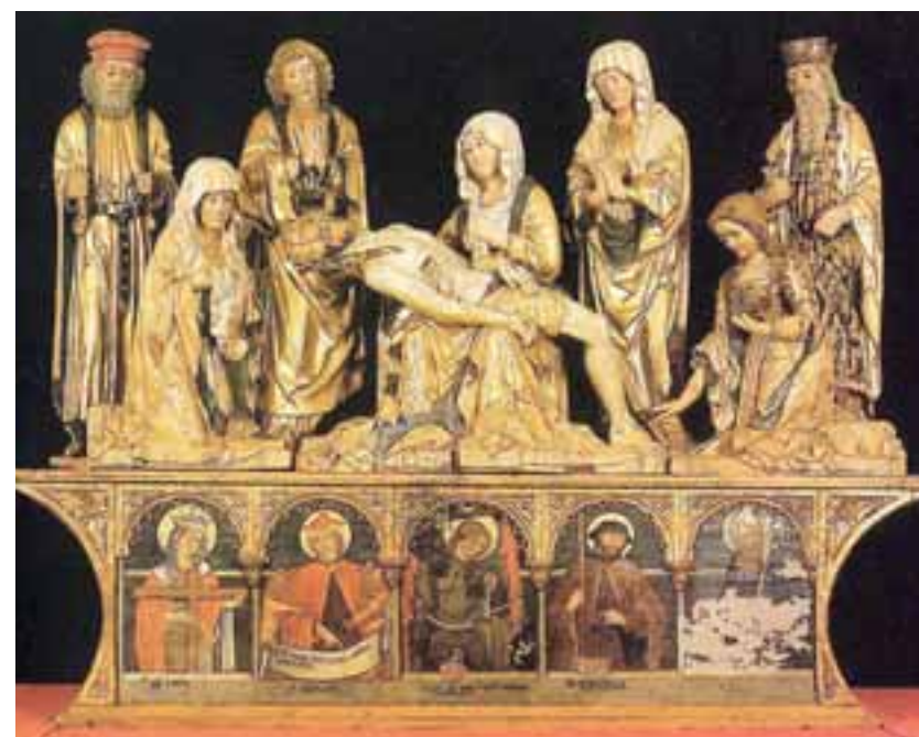
Te foto parsore: il Corot di Leonart Thanner.

Une vore impuartant al è il Crucifis te glesie di Vençon, avonde ruvinât cul taramot dal 1976 e cumò tornât adun. E ancje il Flugelaltar di Sant Blâs a Mediis, lavôr di un bon nivel plastic. L'or-