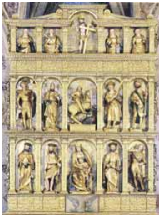
Te foto: il politic te glesie di Gjeri, fat di Antoni Tirone tal 1522.

La opare plui viere tra chês restadis al è un altâr di len fat pe glesie di Trave. Di miôr fature a son lis trê statuis ancjemò esistentis intune ancone di sis ricuadris costruide tal 1516 pe glesie di Pesaris. Si ricognossin i titolârs de glesie Sant Jacum Maiôr, Sant Pieri e Sant Zuan Batiste. Il politic fat pe glesie di Sant Martin di Voleson al è stât stimât 140 ducâts; a son restadis trê statuis: Sant Jacum, Sant Fran-