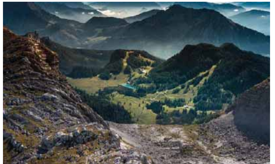
Une des fotos publicadis tal numar speciâl di «Alpiscena» pai 70 agns di «Cipra»

Lis «Rêts alpinis» ch'â operin in di di vuê a son: «Alleanza nelle Alpi», ch'è ten adun 316 Cumons dal arc alpin (cun Barcis, Budoie, Claut, Clausêt, Comeliâns, Cjanive, Cjistielnûf,