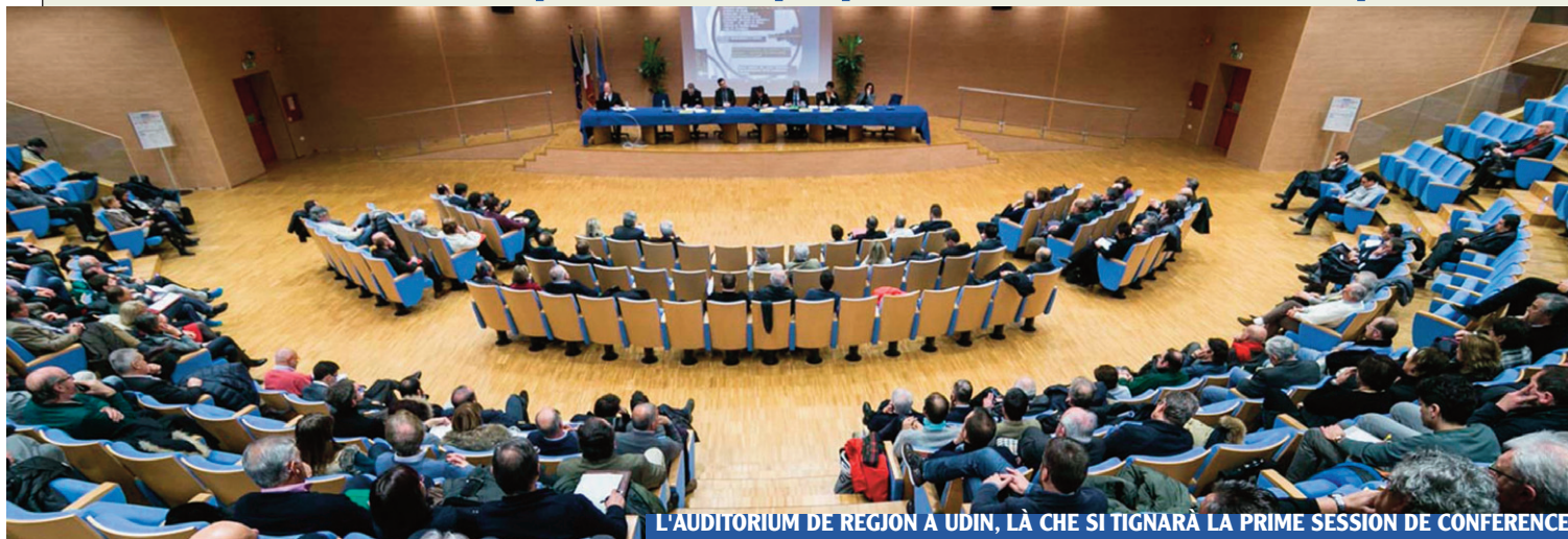
L'AUDITORIUM DE REGION A UDIN, LÀ CHE SI TIGNARÀ LA PRIME SESSION DE CONFERENCE

Vinars al 1n e sabide ai 2 di Dicembar si tignarà a Udin la seconde Conference di verifiche e di propueste pe lenghe furlane. Di fat, in atuazion dal art. 30 de L.R. 29/2007 (Normis pe tutele, valorizazion e promoziun de lenghe furlane), il President dal Consei regionâl al clame, almancul une volte ogni cinc agns e dut câs no plui di sis mès prime de scjadince de legislature, une Conference di verifiche e di propueste su la atuazion de leç inerente ae tutele, valorizazion e promoziun de lenghe furlane.