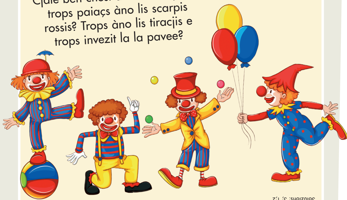
Soluzioni: 3; 1; 2

Cjale ben chest dissen e rispuint: trops paiaçs àno lis scarpis rossis? Trops àno lis tiracjis e trops invezit la la pavee?