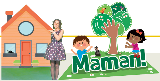
Projet promovût di 'La Vôs dai Furlans' e 'ARLeF'