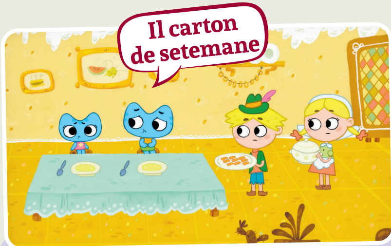
Il carton de setemane