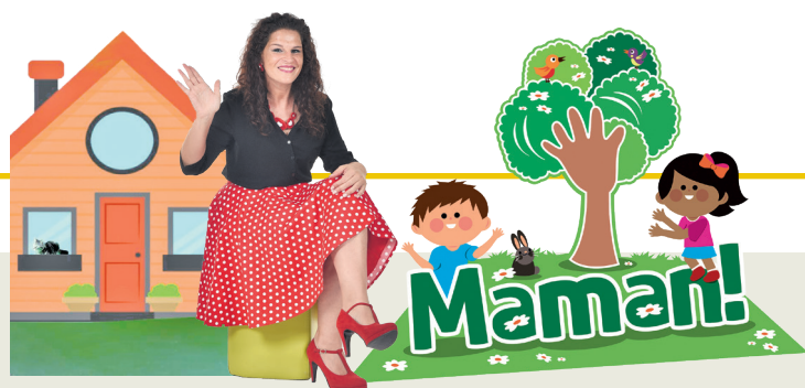
Projet promovût di 'La Vôs dai Furlans' e 'ARLeF'