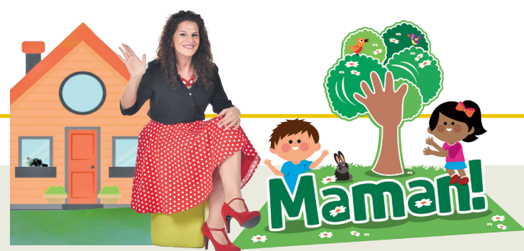
Projet promovût di 'La Vôs dai Furlans' e 'ARLeF'