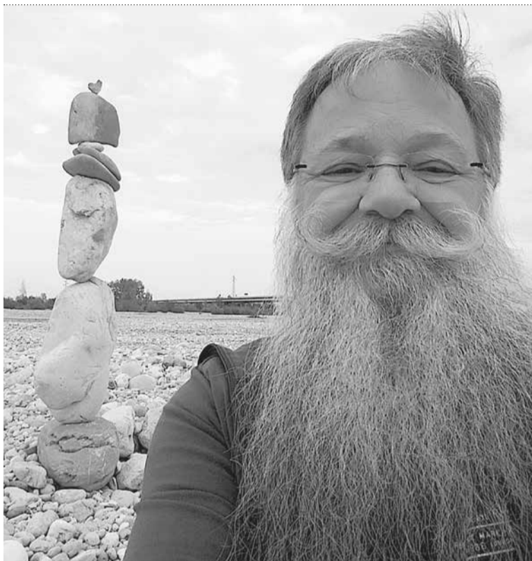
GABRIELE MENEGUZZI, L'ECUILIBRIST DAI CLAPS